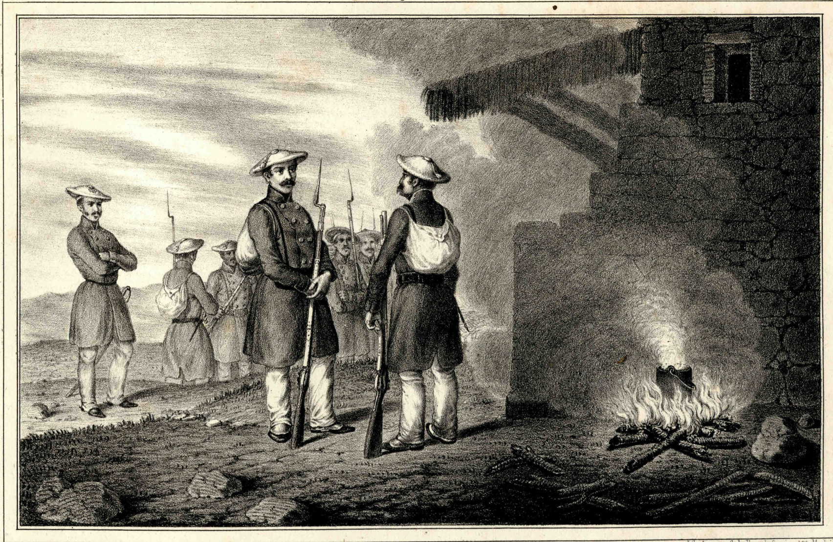
Miranda lo dib.