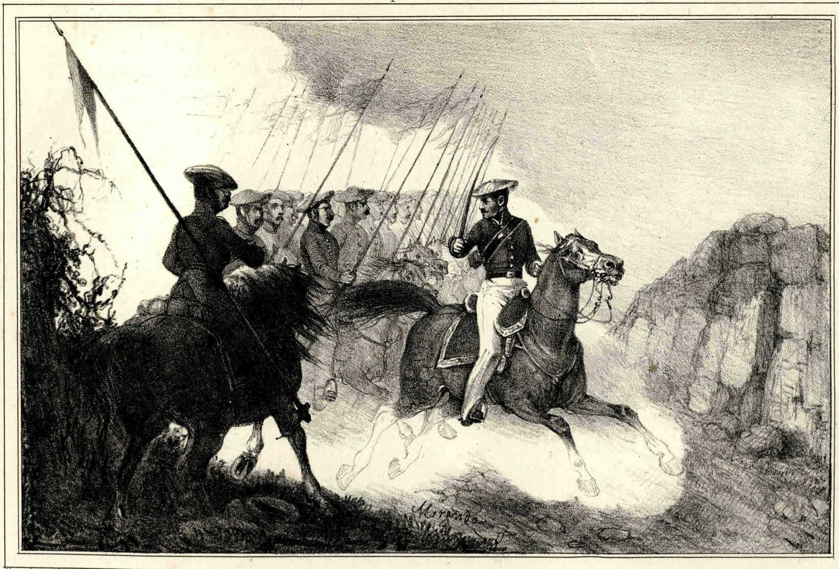
Miranda lo dib o y lit o :

Lit. Nueva C o del Caballero de Gracia 22 Madrid