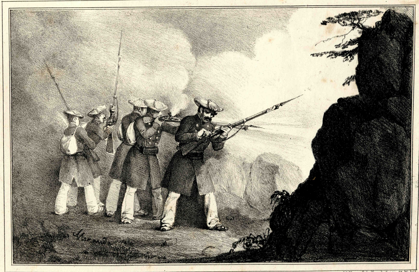
Miranda lo dibijó lit.