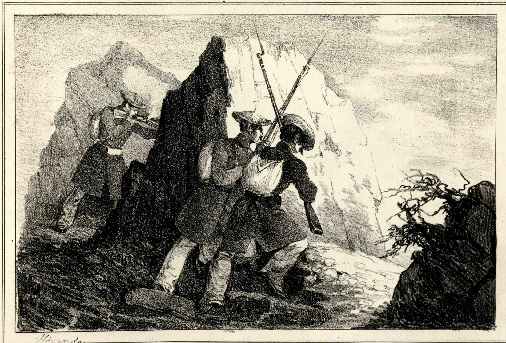
Miranda dib. y lit.