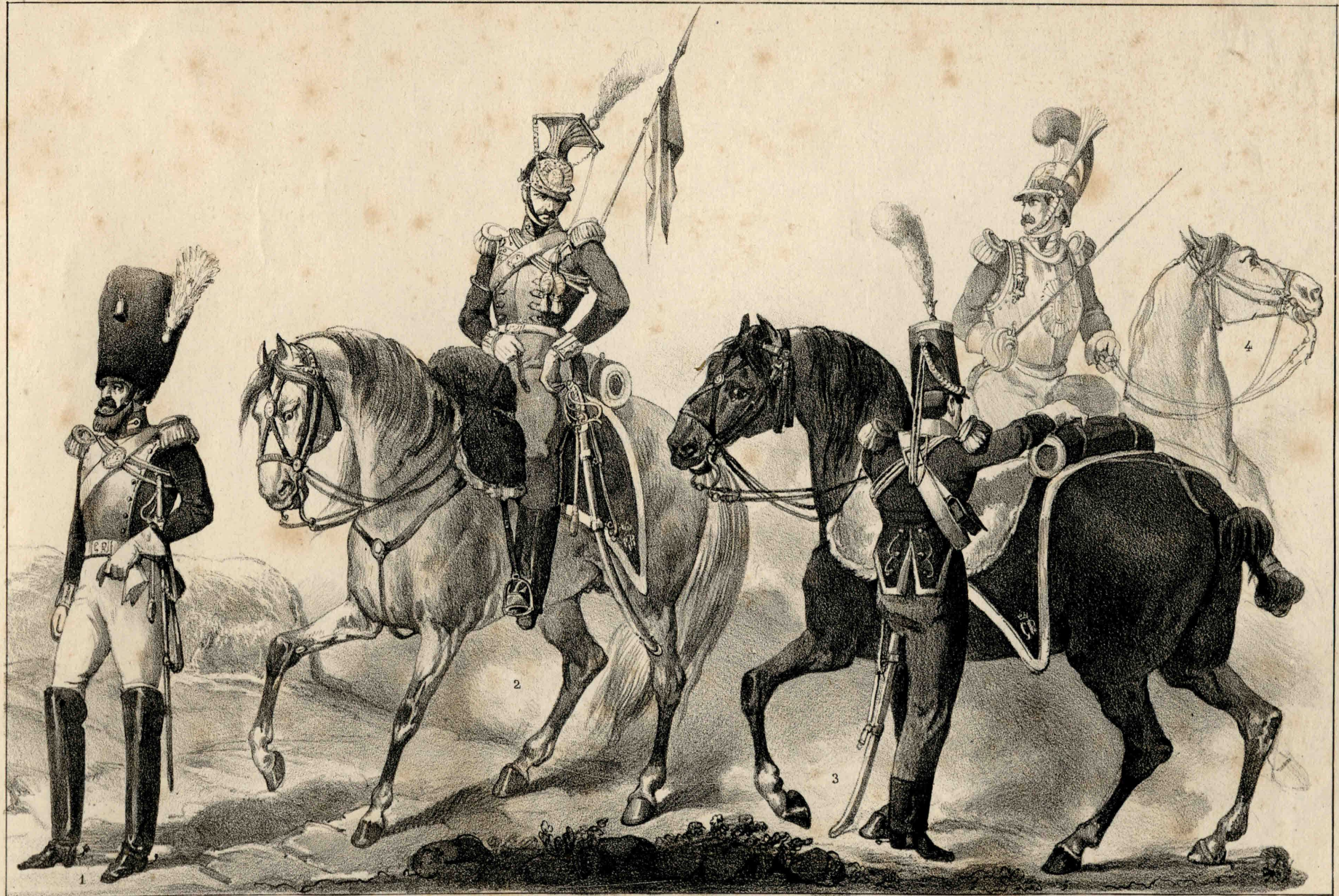
GUARDIA R. DE CABALLERIA. 1. Regimiento Granaderos à caballo. 2. Idem de Lanceros. 3. Idem de Caraboneros. 4. Idem de Coraceros.