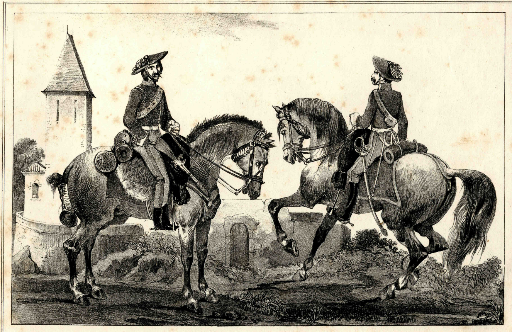
Urrabieta lo dib. y lit.