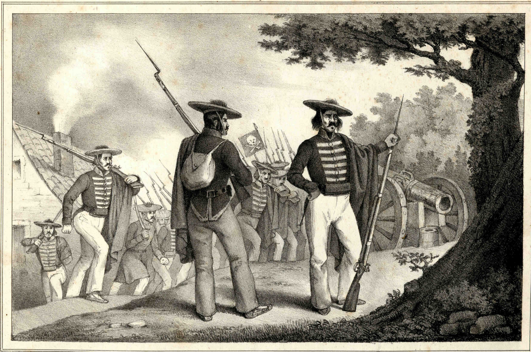
Leopoldo Lopez lo lit.