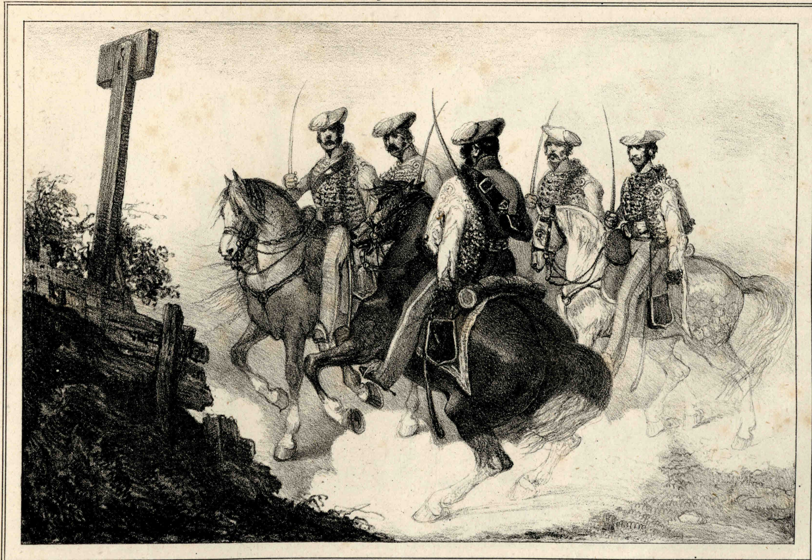
Miranda dib. y lit.