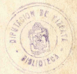
Miranda dib. y lit.