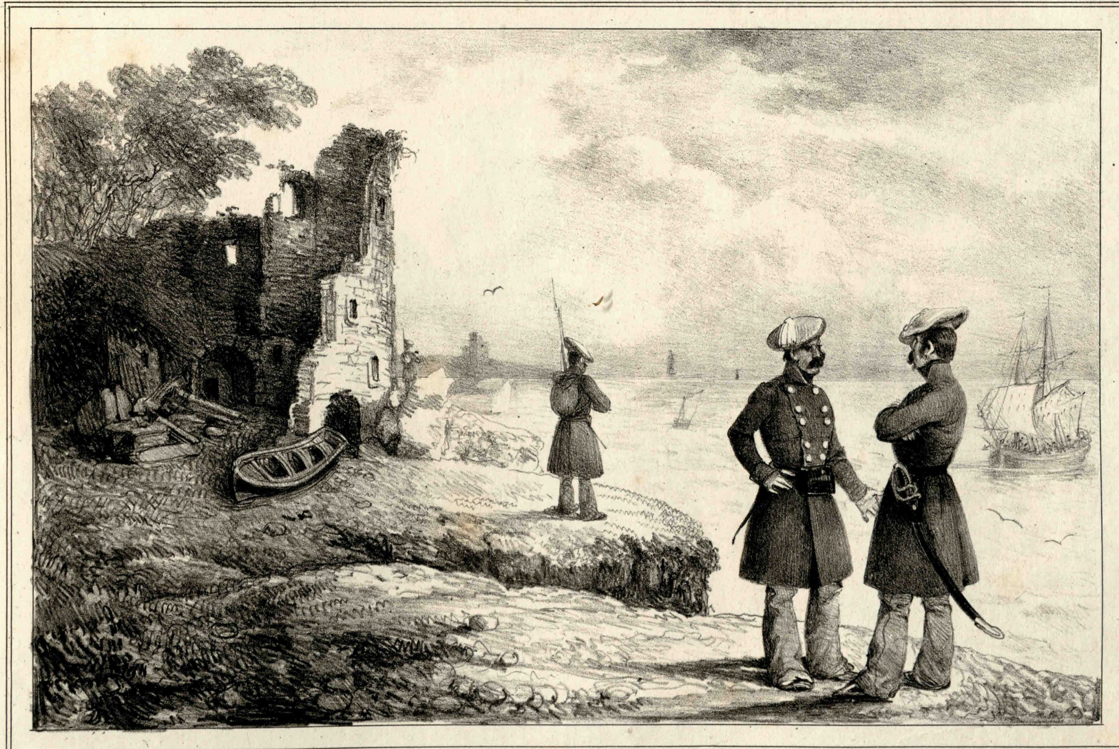
Miranda dib.º y lit.º