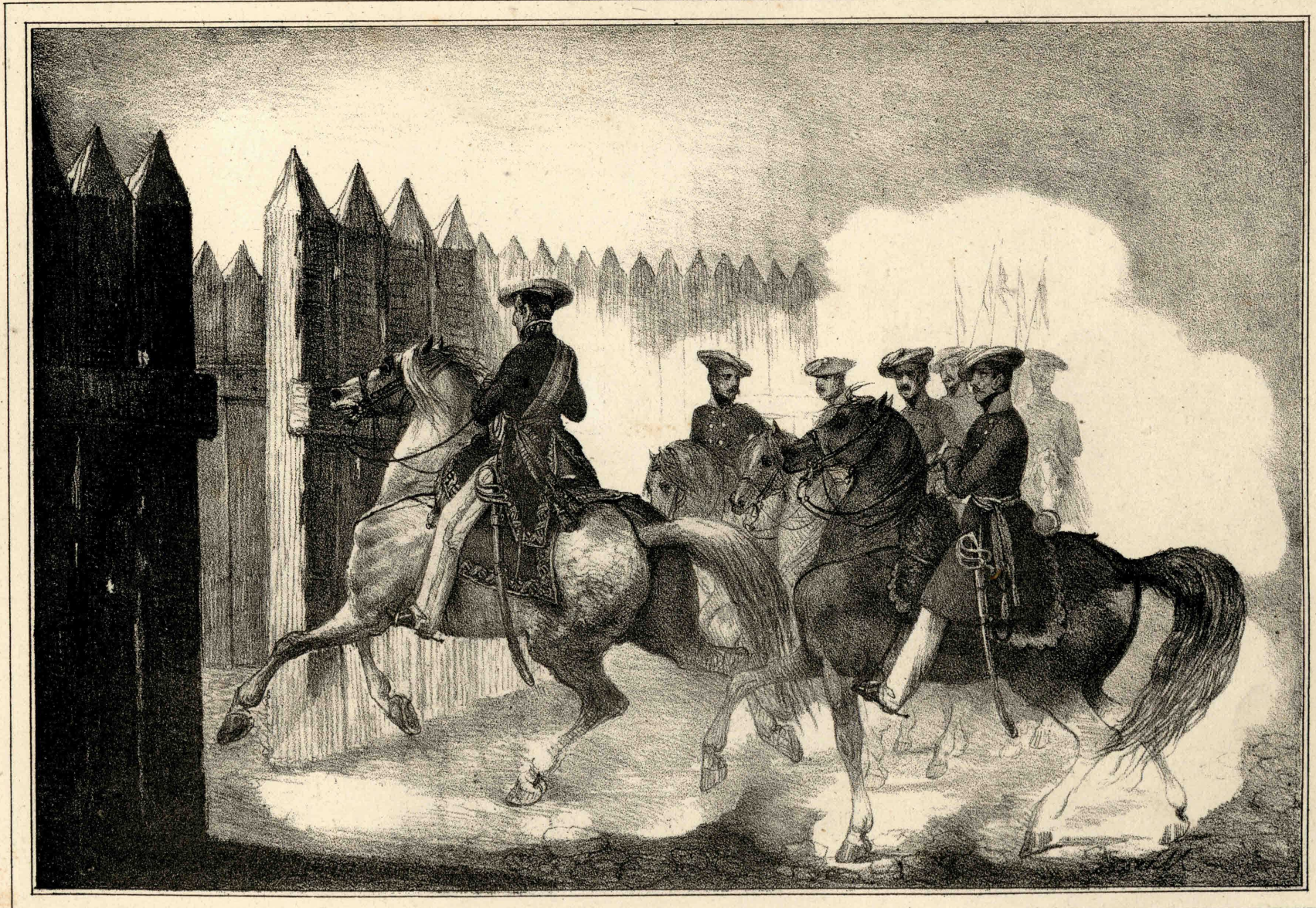
Miranda lo dib' y lit'.