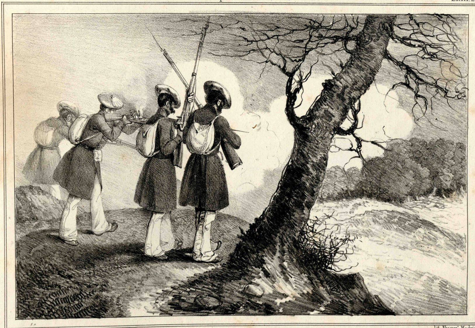
Miranda dib. y lit.