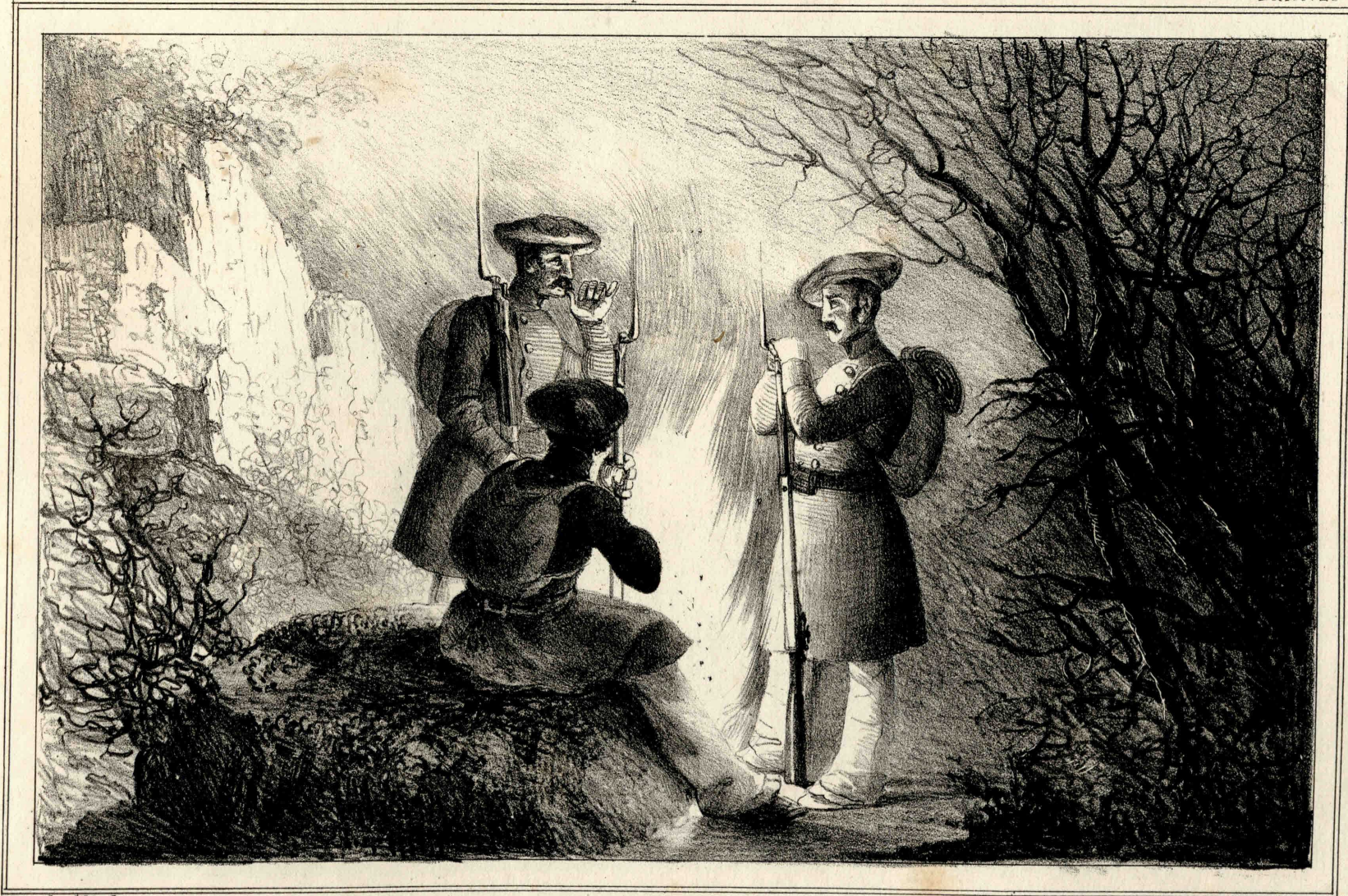
Miranda dib. y lit.