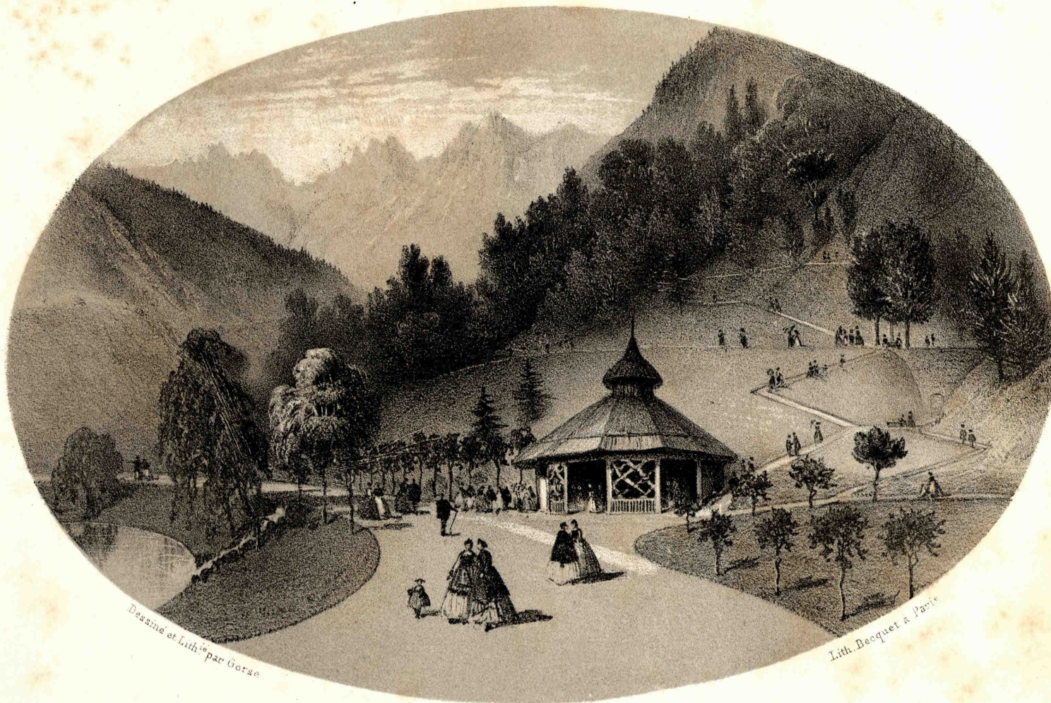
PAVILLON DE LA BUVETTE, A LUCHON.