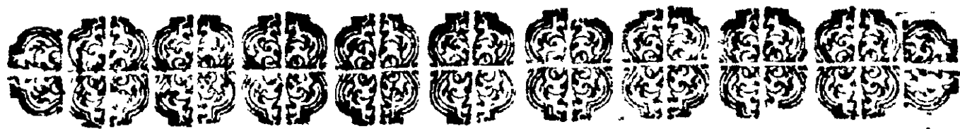
TABLA DE LAS