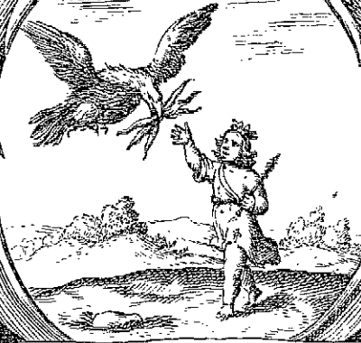
Hęc fert imberbi tela trisulca Ioui.