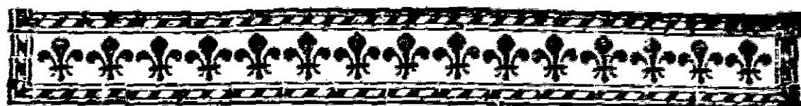
TABLE DES RUBRICHEs.